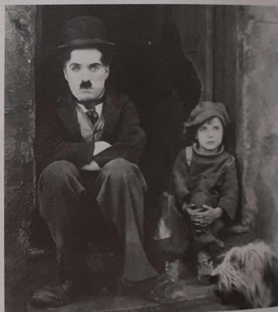
Brzdąc , amerykański komediodramat z 1921 r. zyskał wielką popularność na całym świecie. Jego

Początkowo filmowcy rejestrowali tylko ważne wydarzenia. Szybko jednak zaczęto realizować filmy, które z czasem stawały się coraz dłuższe i bardziej interesujące. Jednym z pierwszych spośród nich był Podróż na Księżyc z 1902 r., który ukazywał ekspedycję naukowców wyrzucanych z armaty na powierzchnię ziemskiego satelity. Podczas powstawania tego obrazu science-fiction [czyt.: sażens-fiksżn] po raz pierwszy wykorzystano efekty specjalne. W latach 20. XX w. nastąpiła rewolucyjna zmiana w kinematografii, polegająca na udźwiękowieniu filmów. Zaczęto również rejestrować je w kolorze. W 1929 r. po raz pierwszy wręczono Oscary [czyt.: oskary], czyli nagrody przyznawane przez amerykańską Akademię Filmową.